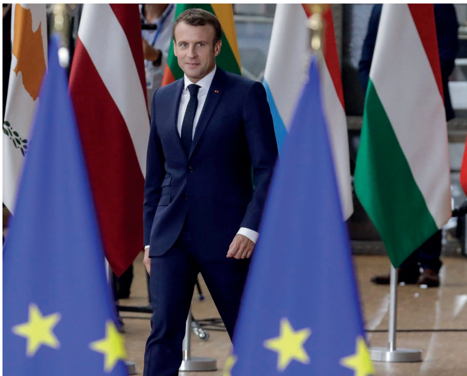
Президент Франции Эммануэль Макрон

Еще больше проблем с мигрантами – у Греции. К тому же во всех ее спорах с Турцией НАТО сохраняет нейтралитет, что вызывает открытое недовольство Афин.