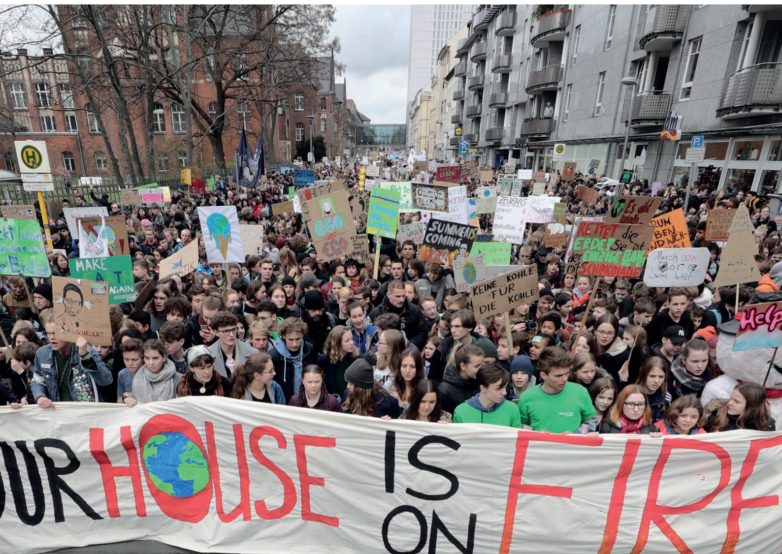
Молодежная демонстрация «Fridays for future»

В 2019 году дискуссии об окружающей среде вытеснили на первый план большой политической сцены. Эмоциональная речь 16-летней активистки Греты Тунберг в ООН поставила под вопрос прошлые достижения руководителей государств в борьбе с глобальным потеплением. Экологическая повестка дня обрела новое измерение. Поиск оптимальной стратегии по защите окружающей среды дополнился эмоциональным протестом, апеллирующим к чувствам, а не к цифрам. На его стороне – «революционное» экологическое самосознание, юношеский максимализм и бескомпромиссность.