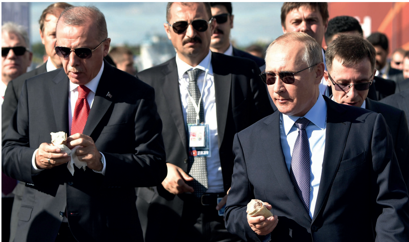
Владимир Путин и Реджеп Эрдоган на авиасалоне МАКС-2019

В нашем пятилетней давности прогнозе мы писали: «Если Россия устоит до 2020 года, если все попытки ее противников не приведут к экономическому коллапсу, хаосу и распаду страны, то можно будет с уверенностью сказать, что доминированию Запада пришел конец. Это значит, что международные отношения официально вступят в новую эру» 1 .