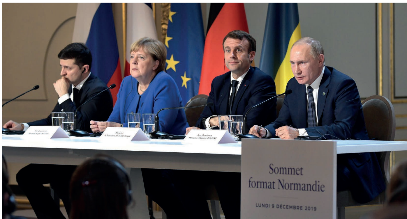
Переговоры «Нормандской четверки» в Париже

Европейская повестка дня в 2020 году не обещает крутых поворотов. Центральным приоритетом по-прежнему останется урегулирование вооруженного конфликта в Донбассе. Этот сюжет подчеркнет общие проблемы европейской безопасности и роль России в ее обеспечении. В какой форме страны НАТО готовы к участию Москвы в укреплении стабильности в Европе?