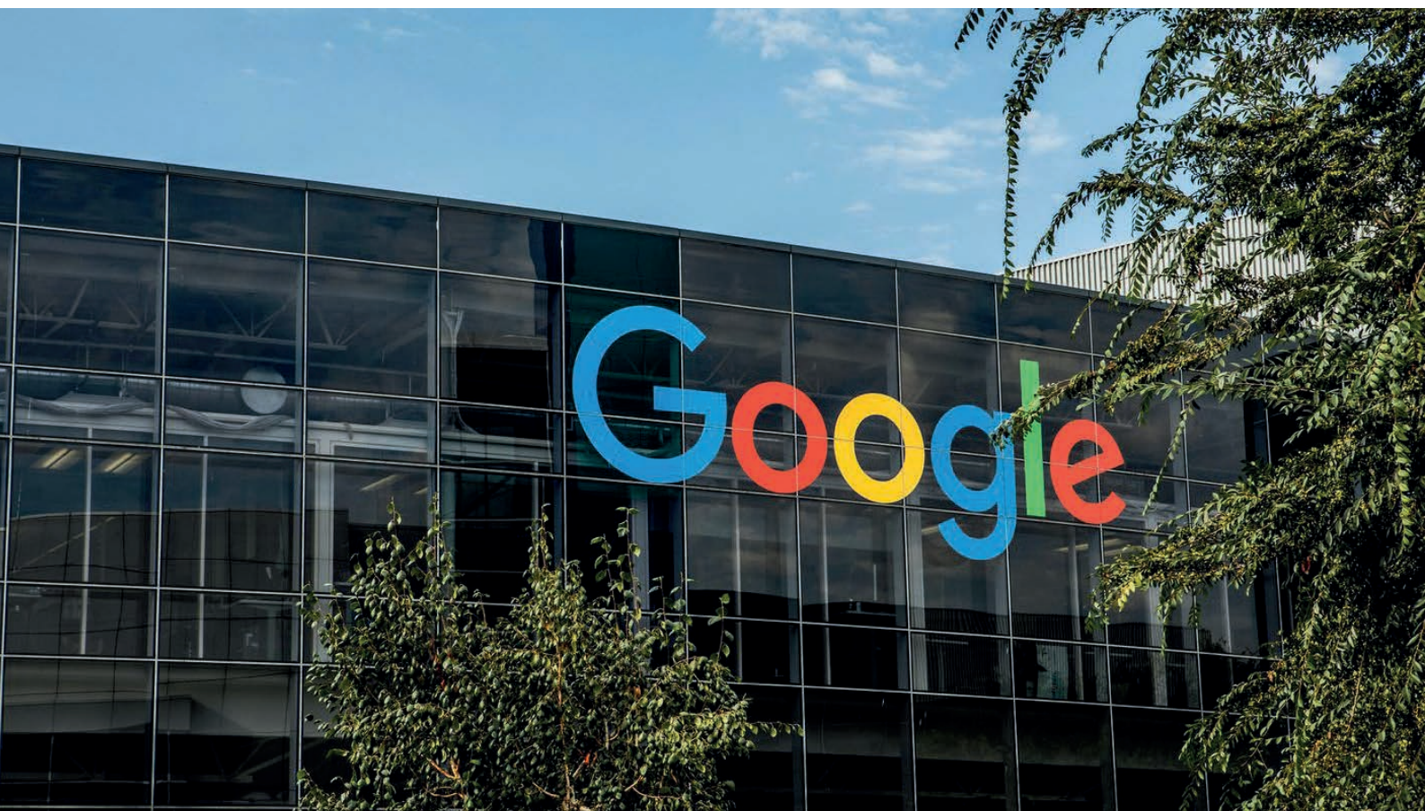
Штаб-квартира корпорации Google

В мире начался процесс формирования альянсов для конкуренции в новом технологическом цикле. Эти альянсы можно назвать техноэкономическими блоками, поскольку в их основе лежат конкурирующие технологические платформы – совокупность разработанных на национальном уровне передовых технологий (когнитивных, вычислительных, передачи и шифрования данных и др.) и построенных на их базе инструментов (поисковиков, мессенджеров, социальных сетей, суперкомпьютеров) – базирующаяся на национальной инженерно-технологической школе. В конкуренции нескольких национальных технологических решений и связанных с ними экономических и социальных моделей может родиться общество, оптимально адаптированное к будущему технологическому укладу и