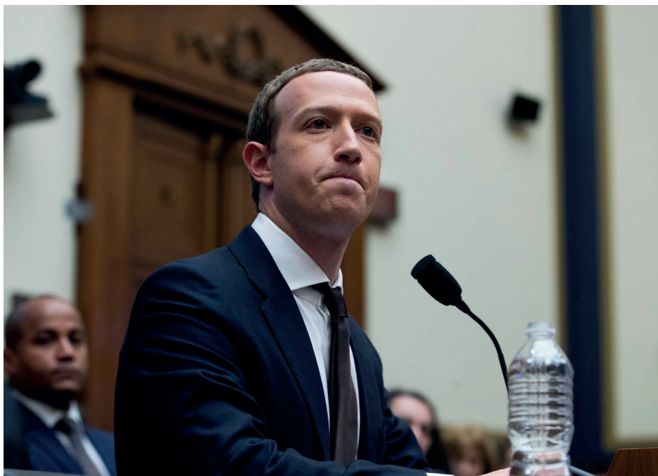
Марк Цукерберг на слушаниях в Конгрессе США

Нормативная основа работы здесь – выработка единых технологических и правовых стандартов хранения, передачи и оборота данных, порядка разметки больших данных, совместимых криптоалгоритмов, а политэкономическая – в продвижении российских цифровых продуктов на внешних рынках: