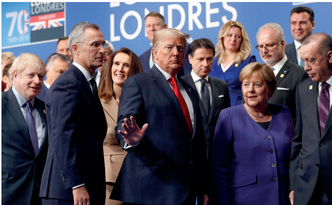
Участники Саммита глав государств НАТО в Лондоне

правила игры после окончания «холодной войны», пригласили за стол своих союзников, единственной ролью которых было играть в «мировое общественное мнение».