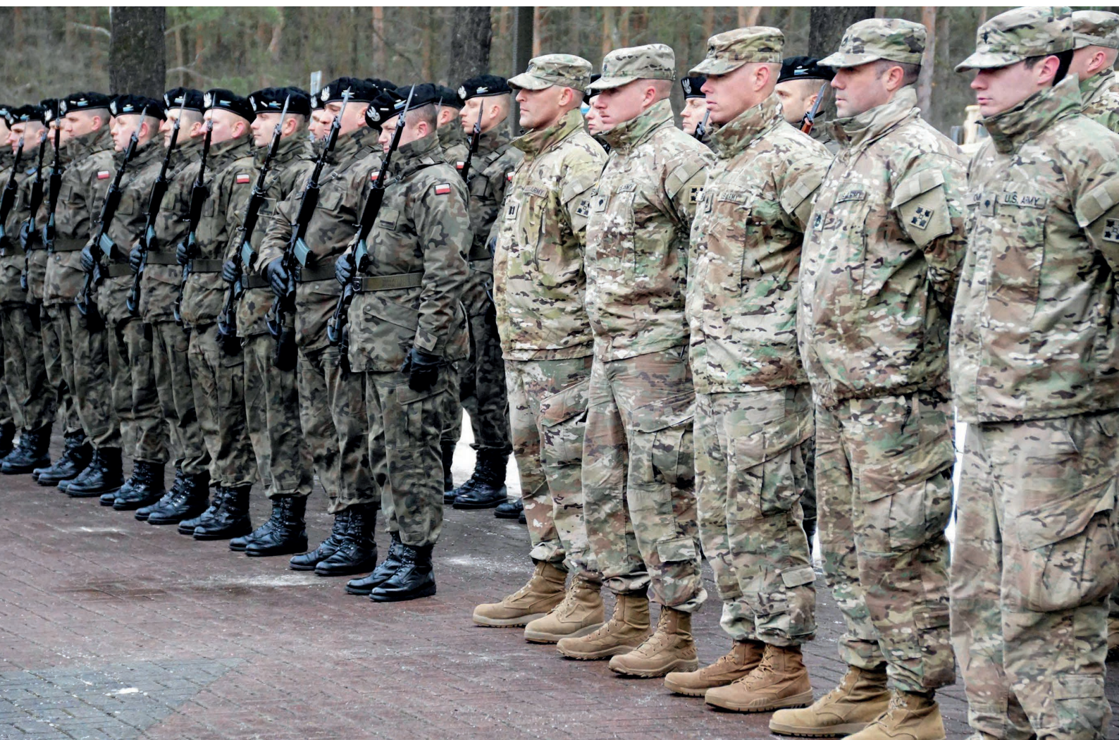
Американские и польские солдаты в Польше

Членство в НАТО и ЕС не гарантирует странам-участницам отсутствие противоречий и взаимных претензий. Главным возмутителем спокойствия в Альянсе является Турция, развивающая вопреки США военно-техническую кооперацию с Россией и проводящая самостоятельную политику на Ближнем Востоке. В этой связи в 2020 году две турецкие базы НАТО останутся объектами двухстороннего торга.