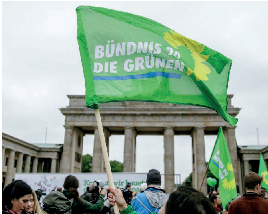
Демонстрация в поддержку партии «Зеленые» в Берлине

Возможно, что в недалеком будущем всплеск политической и медийной активности заставит Россию публично определиться со своей позицией, тем более что в сфере сохранения окружающей среды Россия может играть активную и позитивную роль. Нельзя забывать о потенциальных по-