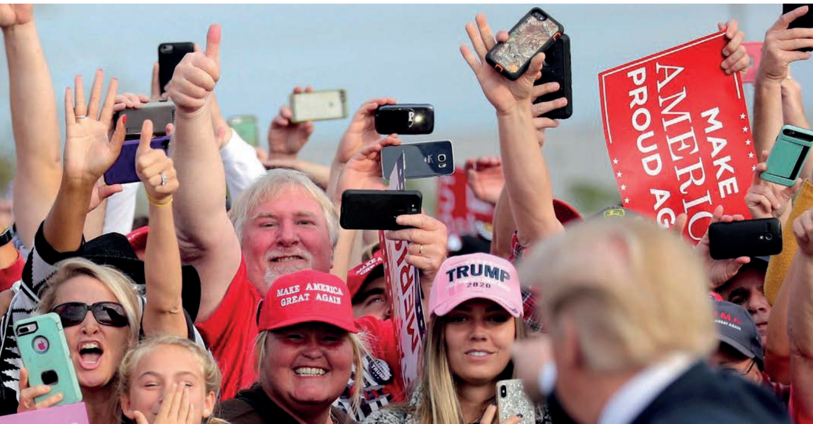
Дональд Трамп со своими сторонниками

2020 год будет переломным для США и всего мира. Грядущие выборы – Президента и Конгресса – во многом зададут Америке вектор движения на последующие десятилетия.